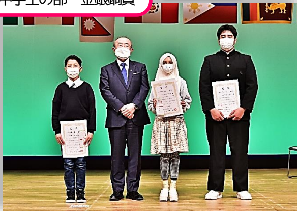
小中学生の部 金銀銅賞