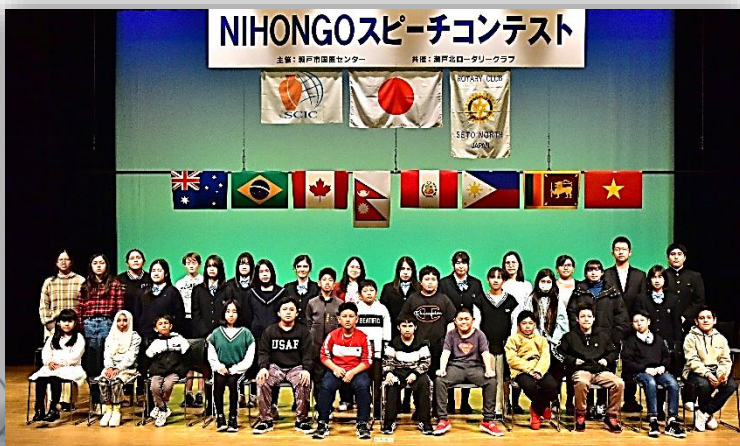
特別賞・瀬戸北ロータリークラブ会長賞