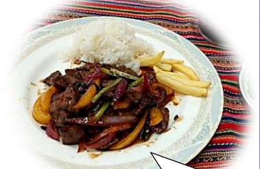
ロモ・サルタード