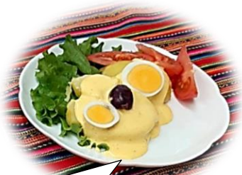
パパ・ア・ラ・ワンカイナ