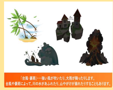
「台風・豪雨」…強い風が吹いたり、大雨が降ったりします。台風や豪雨によって、川の水があふれたり、山やがけが崩れたりすることもあります。